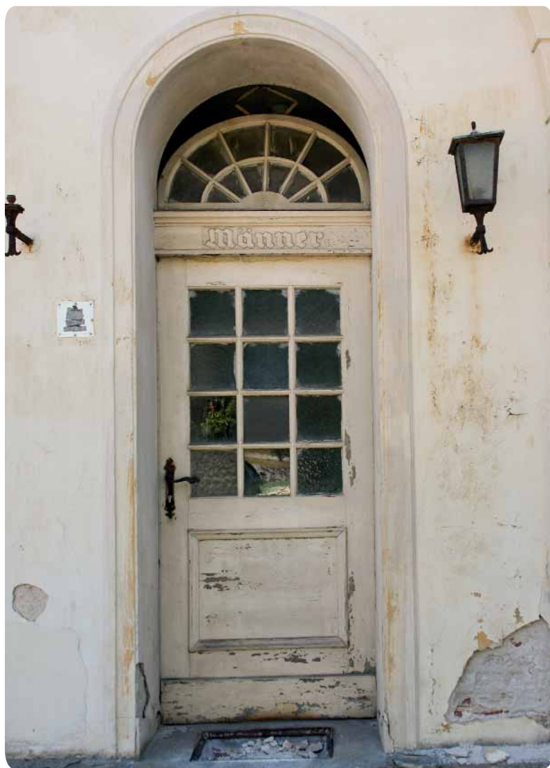
Ehemaliges Pissoir in der Rudolf-Breitscheid-Straße 10.