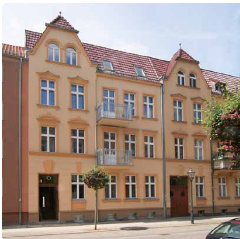
Das sanierte Haus Virchowstraße 36 (links) bildet mit dem Nachbarhaus optisch eine Einheit.

Die NWG hat das Haus Virchowstraße 36 saniert, im Juli kann es bezogen werden. Im Haus befinden sich vier Wohnungen – eine pro Etage. Die Wohnung im Erdgeschoss hat zwei Zimmer, in den Obergeschossen sind es jeweils drei Zimmer. Auf der Hofseite wurden Balkons angebaut, die Grünfläche ist bereits angelegt. Bei der Fassadengestaltung passte sich die NWG an das Nachbarhaus an und berücksichtigte die Auflagen des Denkmalschutzes. So wurden zur Straße hin die alten Holzfenster aufgearbeitet. Um trotzdem die Anforderungen an die Wärmedämmung zu erfüllen, befindet sich hinter den äußeren Fensterflügeln ein modernes Fenster aus Verbundglas. Auch zur Straße gibt es wieder Balkone, dem historischen Vorbild nachempfunden. Rund ein Jahr dauerte die Sanierung, denn das leerstehende Gebäude wies größere Schäden auf. Durch das defekte Dach war über Jahre Wasser eingedrungen und hatte Teile des Mauerwerks durchnässt. Die NWG übernahm das Haus erst