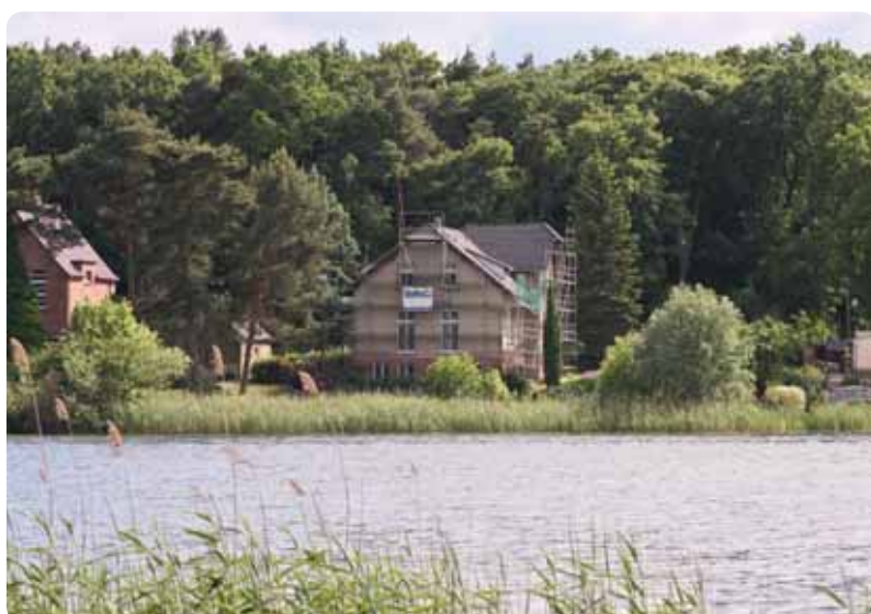
Idylle an der Lanke, hier saniert die NWG ein Wohnhaus für drei Familien.

Auch wenn die Baugerüste noch stehen – es braucht wenig Phantasie sich vorzustellen, was für eine Perle das um 1900 errichtete Wohnhaus in der Dorfstraße 38 in Wuthenow bald sein wird. Das an der Lanke gelegene Haus hat einen eigenen Seezugang. Von den drei Mietwohnungen sind zwei 110 Quadratmeter groß, die Wohnung im Dachgeschoss hat 90 Quadratmeter. Die oberen Wohnungen bekommen auf der Seeseite neue Balkone, im Souterrain eine Terrasse. Der großzügige Garten wird von der NWG angelegt und kann von den Mietern benutzt werden. ◀