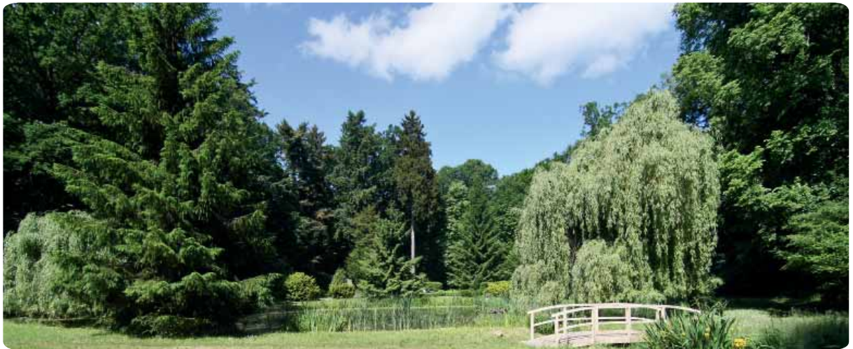
Im Stadtpark wurde aufgeräumt. Die marode Holzbrücke am Goldfischteich wurde von den Stadtwerken durch eine neue ersetzt.