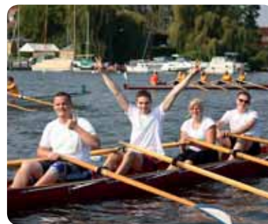
Sieg oder Platz? Egal! Die Teilnahme dient einem guten Zweck.

Sporttherapie zu ermöglichen. Bei schönstem Wetter verfolgten im vergangenen Jahr 1000 Zuschauer das Rennen an der Neuruppiner Seepromenade. Die meisten Teilnehmer werden auch in diesem Jahr Amateurruderer sein. Viele sitzen bei „Rudern gegen Krebs“ abgesehen von einigen Trainingsstunden zum ersten Mal im Boot. Der Neuruppiner Ruderclub hilft den Neulingen. ◀