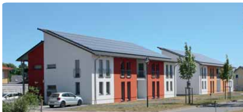
Vorbild in Sachen Energieeffizienz sind die Neubauten der NWG Am Fehrbelliner Tor 12 – 16.

Bei steigenden Energiepreisen erhöht sich auch die Akzeptanz für eine energetische Sanierung. Allerdings kostet Energieeffizienz fast immer mehr Geld, als in den ersten Jahren an Energiekosten eingespart wird. Wir müssen darum aufpassen, dass nicht die letzten günstigen Wohnungen wegsaniert werden. ◀