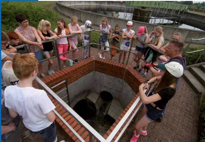
Schülerbesichtigung der Kläranlage

Ihre Stadtwerke Neuruppin GmbH Neuruppin, im Januar 2019.