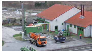
Fäkalienannahmestation KA Neuruppin