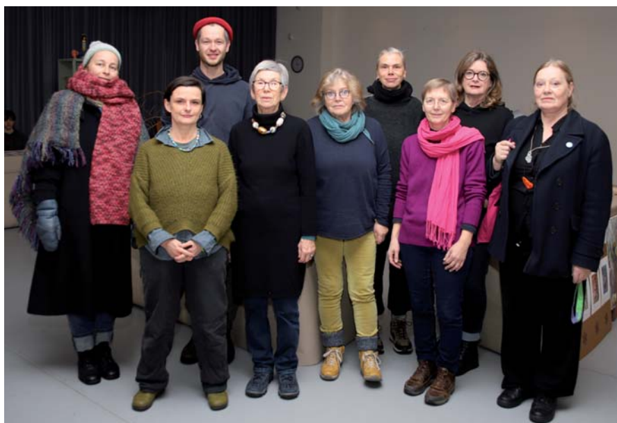
Kunstschaffende beim Kunst-Portal, einer gemeinsamen Präsentation ihrer Werke.