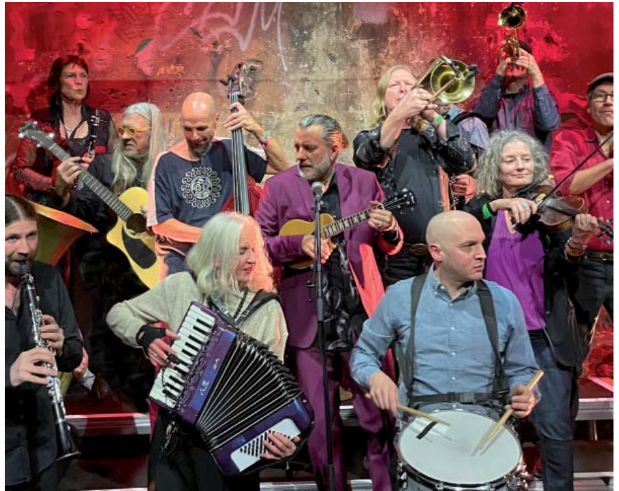
Mit 17 Hippies kommt eine Band nach Neuruppin, die einzigartig in Deutschland ist.

Dass aus dem anfänglich losen Gefüge eine feste Größe, ein Konzept, eine ganze musikalische Welt mit eigenem Sound entstehen würde, hätte zur Gründung 1995 keiner vermutet. Techno war angesagt und Akustikinstrumenten haftete die Vergangenheit einer analogen Welt an. Das erste Album sollte damals noch auf einer Kassette heraus-