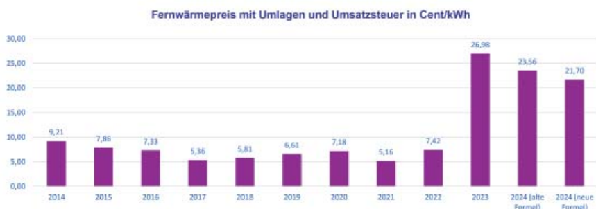
Abbildung 2: Kostenentwicklung 2021-2024