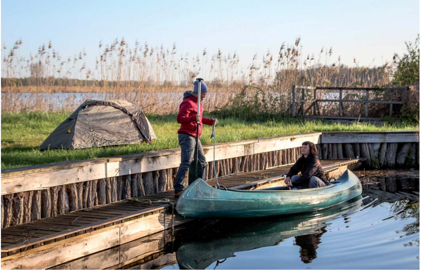
Zwei Kanufahrerinnen machen sich in Linum im Rhinluch auf die Reise. Durch das Deutschlandticket sind Reisen auch mit kleinem Geld möglich.