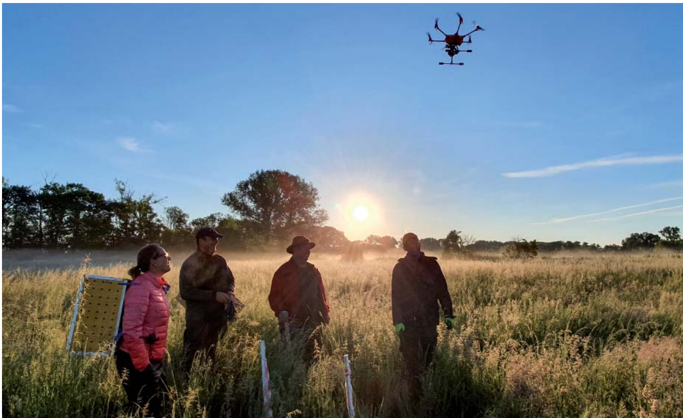
Die Helfer bei Sonnenaufgang in Aktion. Die Drohne hebt ab, um Kitze und andere Tiere vor der Mahd aufzuspüren.