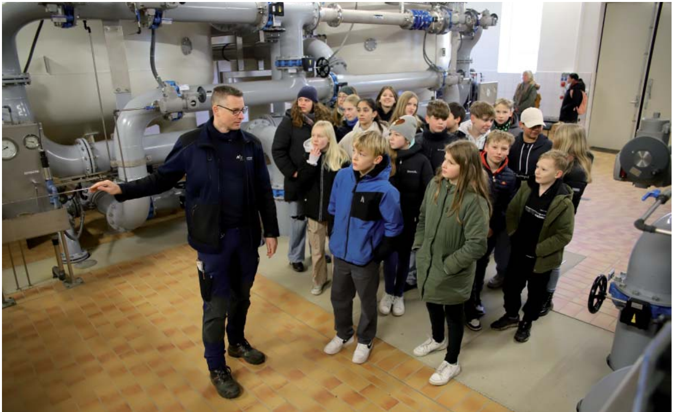
Die Klasse 6a der Rosa-Luxemburg-Schule besichtigt das Wasserwerk. Energie und Wasser sind Unterrichtsstoff und Thema der Projekttage.