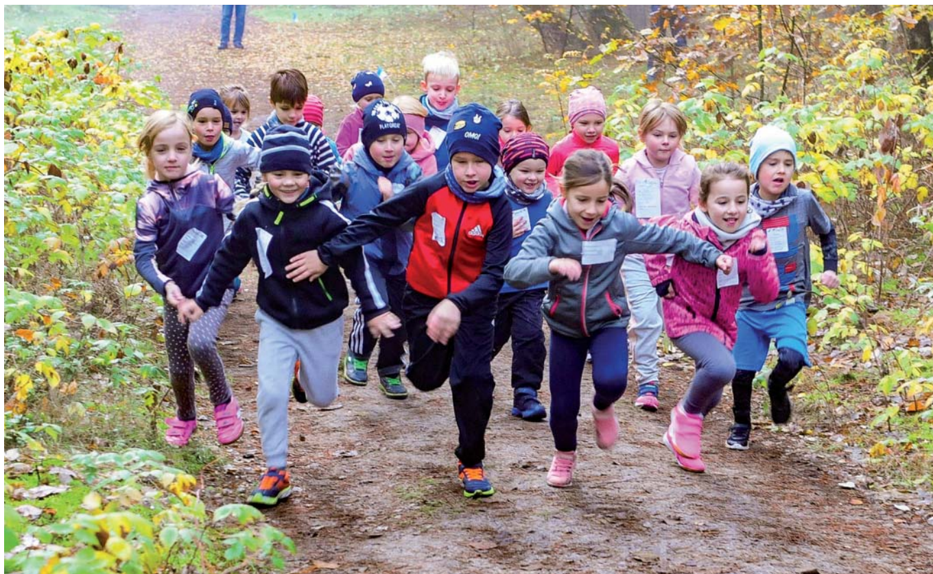
Ein Klassiker der Arbeit des Kreissportbundes Ostprignitz-Ruppin ist der jährlich stattfindende Herbstcrosslauf.