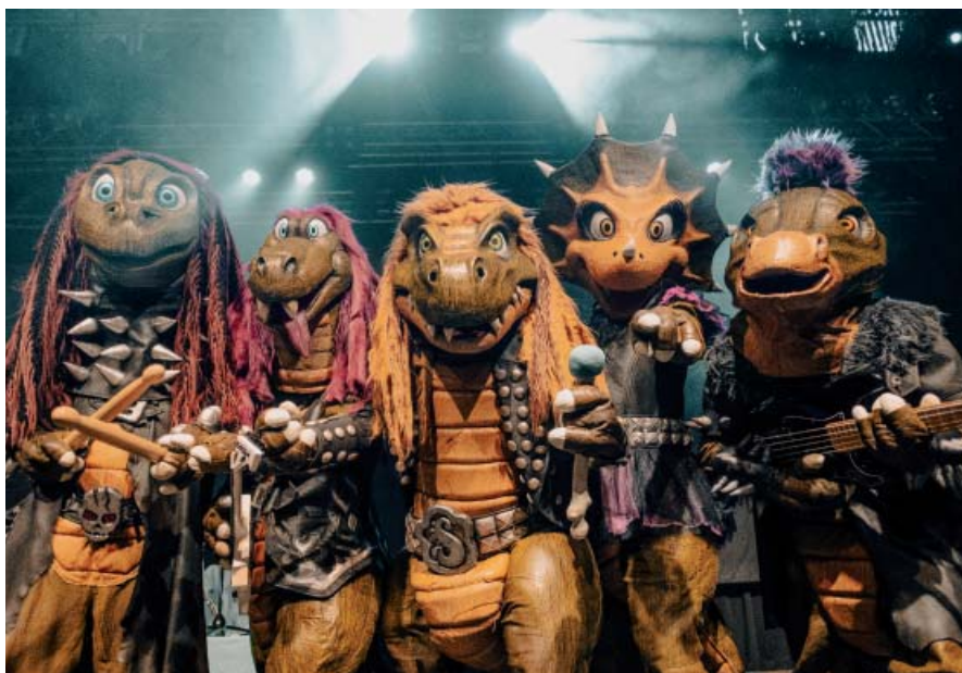
Familienerlebnis Dino-Rock mit der heißesten Band für Kinder.

Und der Spaß geht weiter! Für 2023 steht die nächste Heavysaurus-Kon-