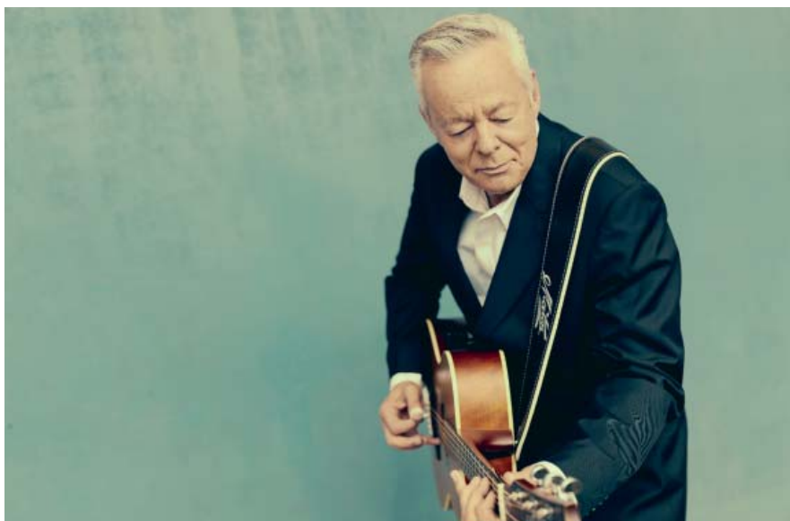
Tommy Emmanuel auf Welttournee – zu Gast in der Kulturkirche Neuruppin.

Der legendäre Eric Clapton nannte ihn den „großartigsten Gitarristen, den ich jemals gesehen habe“. Emmanuel bietet anspruchsvolle Handwerkskunst bei seinen stilistisch vielfältigen Eigenkompositionen und Cover-Versionen. Der 67-Jährige ist einfach nicht zu bremsen – mit jährlich bis zu 300 Konzerten und regelmäßig neuen Alben. Er gehört mit seinem einzigartigen Gitarren-Stil und der herausragenden Technik zu den renommiertesten Fingerpickern der Welt, ganz im Geiste des großartigen Chet Atkins. Im Laufe seiner sechs Jahrzehnte dauernden Karriere – Tommy galt schon als Junge als Gitarren-Wunderkind – veredelte der Australier die Musik so unterschiedlicher