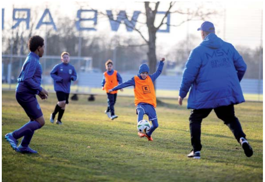
Beim MSV Neuruppin kommt der neue EM-Ball schon zum Einsatz.

Neuruppin punktete als EM-Quartiergeber gegen Potsdam und Bad Saarow, die ebenfalls in der Auswahl waren, und ist damit das einzige EM-Quartier im Land Brandenburg. Von hier aus werden die Kroaten zunächst zu den drei Vorrundenspielen reisen und dazwischen auf gut gepflegtem Rasen im Volksparkstadion ihre Übungseinheiten absolvieren. Die Gruppe der Kroaten hat es in sich: Mit Spanien und Italien sind zwei Mannschaften vertreten, die immer zum Favoritenkreis gezählt werden können. Wenn die Kroaten eines der beiden Teams schlagen können, sind die Chancen auf das Weiterkommen groß. Wohnen werden die Fußballer im Resort Mark Brandenburg. Gemeinsam mit dem MSV Neuruppin hatte sich das Hotel beim Deutschen Fußballbund (DFB) erfolgreich beworben. Unter anderem das große Fitnessstudio und das Thermalbad sowie die Nähe zu den Trainingsplätzen haben den kroatischen Verband schließlich überzeugt. Dazu kommt die gute Erreichbarkeit der Orte für die Vorrundenspiele. Das Team wird am 15. Juni nach Berlin, am 19. Juni nach Hamburg und am 24. Juni nach Leipzig reisen. Neben den Spielern, Betreuern und dem Stab der Nationalmannschaft werden auch viele Journalisten und Fans nach