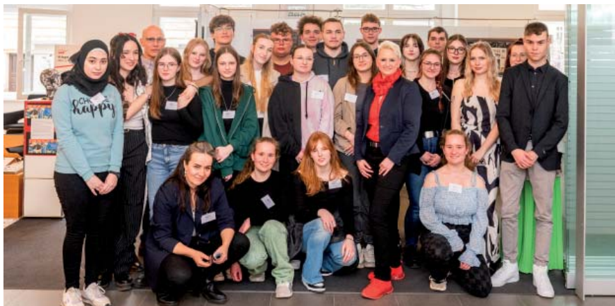
Abiturienten des Oberstufenzentrums zeigten in der Filiale Schinkelstraße ihre Kunst.

Die Mitarbeiterinnen und Mitarbeiter der Sparkasse Ostprignitz-Ruppin sind stolz darauf, dass sich ihr Geldinstitut auch regional engagiert: für Soziales, Sport oder wie in diesem Beispiel für Kunst und Kultur. Auch die Kunden haben etwas davon, so zeigte die Filiale in der Schinkelstraße bis vor Kurzem eine Ausstellung mit faszinierenden Kunstwerken der 13. Klasse des Oberstufenzentrums. Unter dem Motto „Mythos und Realität“ entstanden Werke, die sich mit den großen Herausforderungen unserer heutigen Zeit beschäftigten.